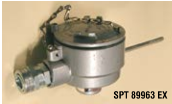
SPT 89963 EX

Опция: Трансмисмитер аналогового сигнала 4-20мА